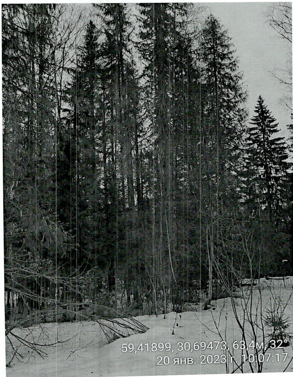
Фото – отчет о выполнении работ по проведению лесопатологического обследования в 2023 году. Лесных насаждений Учебно-опытного лесничества Ленинградской области (субъект РФ) Лисинского участкового лесничества Квартал 206 выдел 60 лп. выд. 60.1 площадь лп. выд. 0,1 га