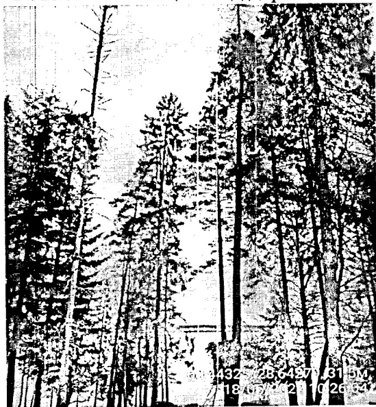
Фото № 2.1 Общий вид дерева