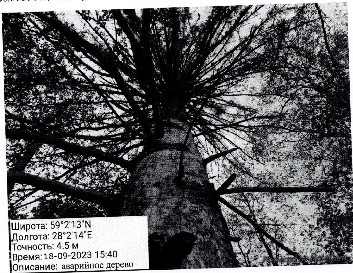
Фото № 1 Общий вид дерева. Усыхание кроны. В кроне много толстых ветвей.

Исполнитель работ по проведению лесопатологического обследования: