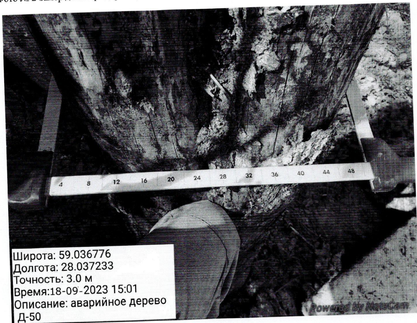
Фото № 2 Замер диаметра дерева. Диаметр на уровне груди составил 50 см, высота 24 м.

Широта: 59.036776 Долгота: 28.037233 Точность: 3.0 м Время: 18-09-2023 15:01 Описание: аварийное дерево Д-50