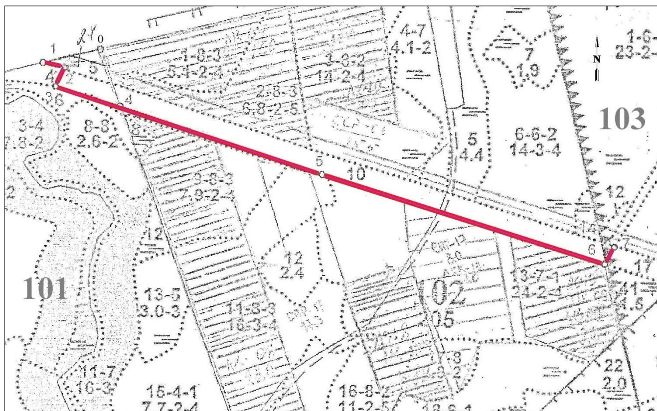
Данные инструментальной съемки

Арендатор: ООО «Газпром трансгаз Санкт-Петербург» Лесничество: Волховское Участковое лесничество: Порожское Квартал, выдел: 101 (часть выд. 4, 27), 102 (часть выд. 10), 103 (часть выд. 17) Общая площадь: 0,981 га Масштаб: 1:10 000 Лист 2 из 3