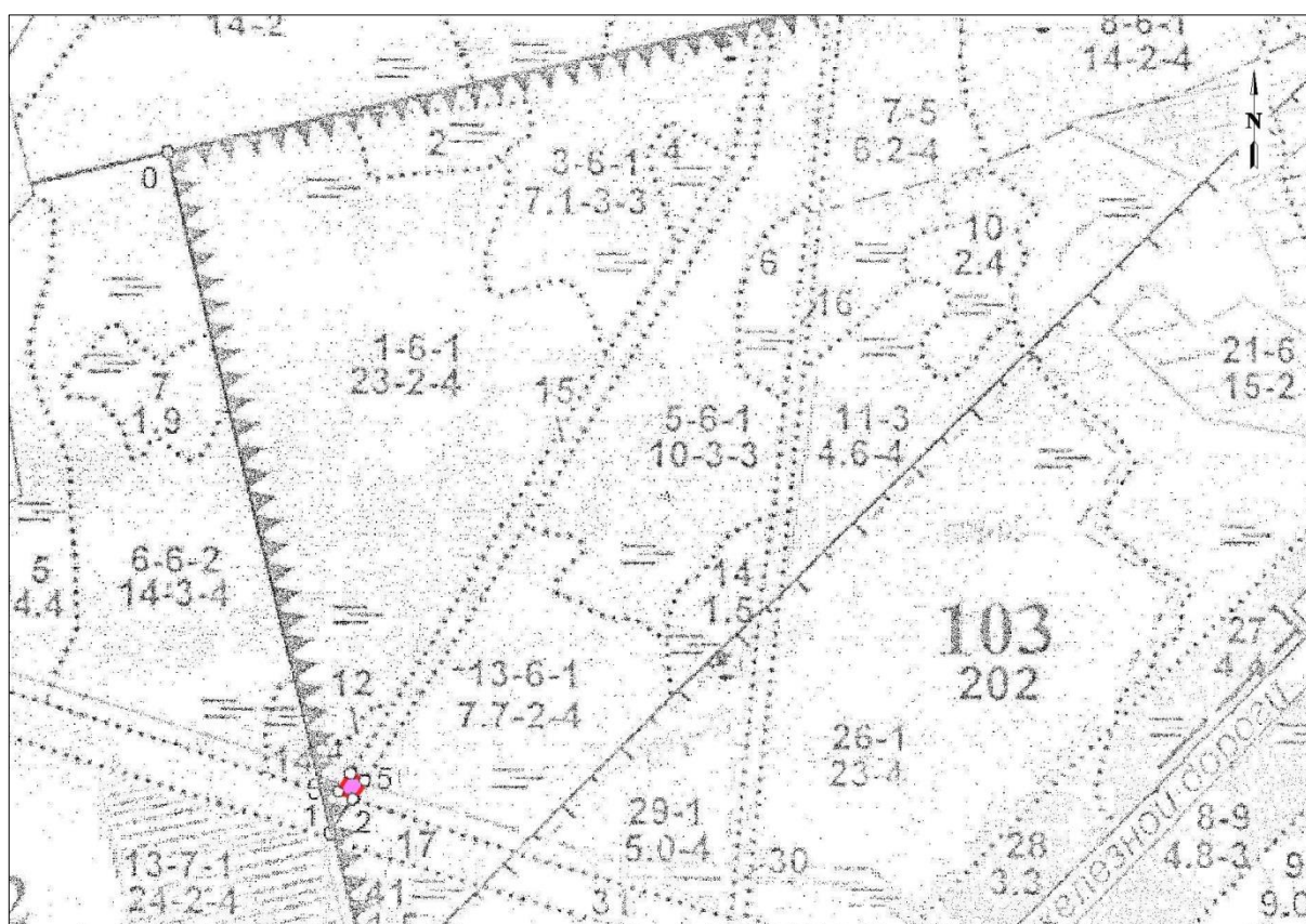
Данные инструментальной съемки

Арендатор: ООО «Газпром трансгаз Санкт-Петербург» Лесничество: Волховское Участковое лесничество: Порожское Квартал, выдел: 103, (часть выд. 15) Общая площадь: 0,040 га Масштаб: 1:10 000 Лист 3 из 3