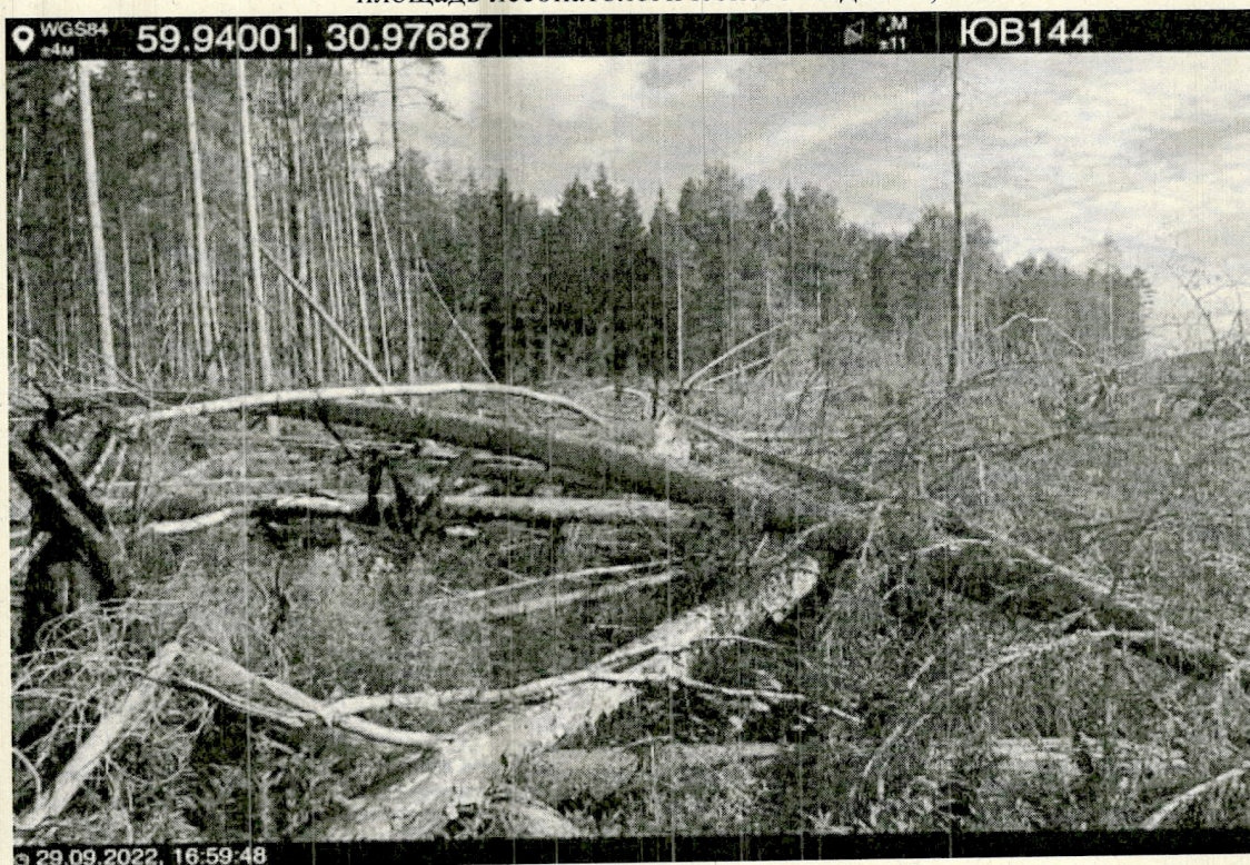
Фото – отчет о выполнении работ по проведении лесопатологического обследования в 2022 году. Лесных насаждений Всеволожского лесничества Ленинградской области (субъект РФ) Морозовского Участкового лесничества Квартал 189 выдел 24 лесопатологический выдел 24.1 площадь лесопатологического выдела 0,6 га.

Исполнитель работ по проведению лесопатологического обследования: